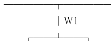
標準電動機分路圖